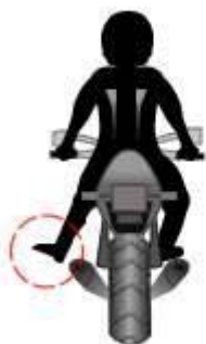
Obstáculo a la izquierda