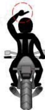
Incorporarse a la fila