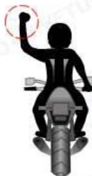
Detener el movimiento