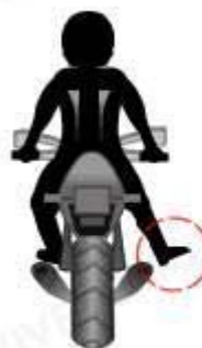
Obstáculo a la derecha