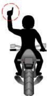
Circular en una fila