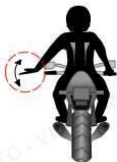
Disminuir la velocidad