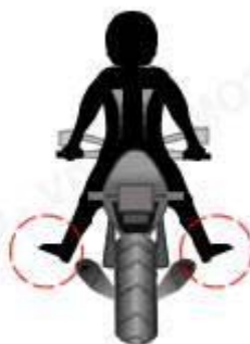
Obstáculo a ambos costados