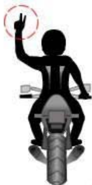
Circular en dos filas